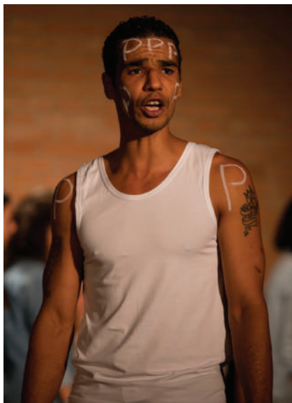
LIBERTÀ VA-N CERCANDO, CH'È SI CARA....., Casa circondariale di Ravenna.