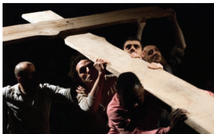
PADRI E FIGLI / primo studio, Teatro delle Passioni di Modena.