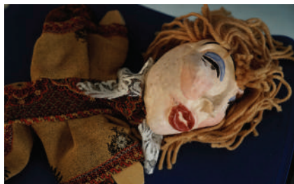
PADRI E FIGLI E LA FRATTURA MIGRATORIA, Istituti penitenziari di Parma.