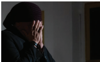
ALBUM DI FAMIGLIA, Casa circondariale Costantino Satta di Ferrara.