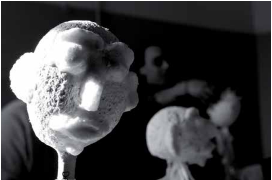
Laboratorio della Cooperativa Le Mani Parlanti, Casa circondariale di Parma, 2013

Per info: info@teatrocarcere-emiliaromagna.it