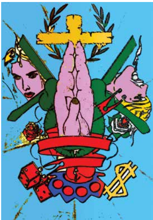
disegno di Luca Alduzzi, attore della Casa di reclusione di Castelfranco Emilia

info@teatrocarcere-emiliaromagna.it www.teatrocarcere-emiliaromagna.it