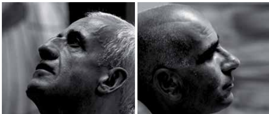
Laboratorio teatrale del Teatro del Pratello, Casa circondariale di Bologna, 2013

Nell'ambito della giornata: presentazione della ricerca sul Teatro Carcere in Emilia Romagna realizzata dall'Osservatorio Regionale dello Spettacolo http://cultura.regione.emilia-romagna.it/osservatoriospettacolo/studi-e-ricerche