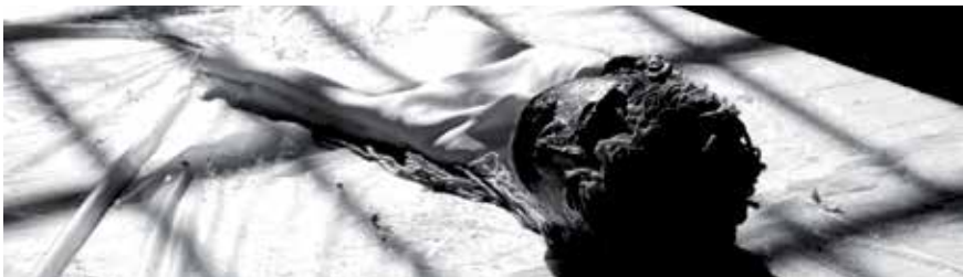
Laboratorio della Cooperativa Le Mani Parlanti, Casa circondariale di Parma, 2013