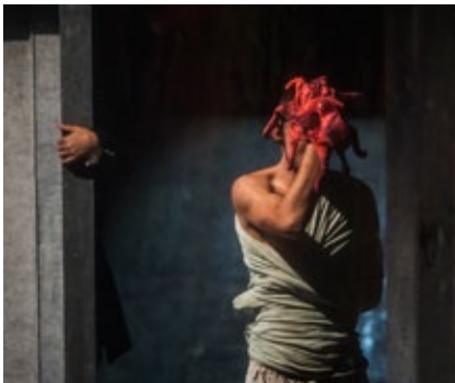
BELLINDA E BESTIA, Istituto Penale per i Minorenni di Bologna.