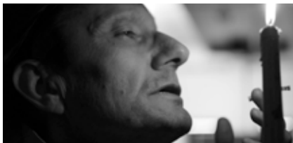
ALBUM DI FAMIGLIA, Casa Circondariale di Ferrara. Riprese per la web-serie, regia video di Marco Luciano