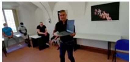
ODISSEA WEB, Casa di reclusione di Castelfranco Emilia. Riprese dal film di Raffaele Manco e Stefano Tè